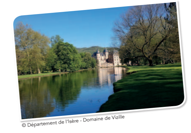
© Département de l'Isère - Domaine de Vizille